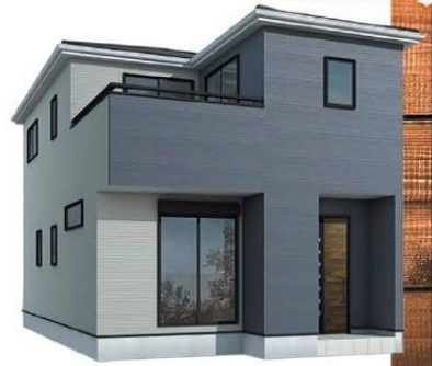
※完成予想図/このパースは図面を基に描いたもので実際とは多少異なる場合がございます。

物件番号 4C78-B0FD | 情報公開日 2025年04月08日 | 広告有効期限 2025年04月23日 | 仲介手数料無料+期間限定キャンペーン実施中!