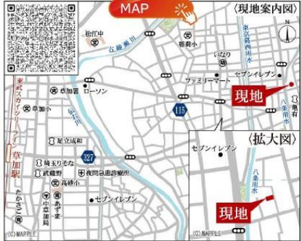
Car navigation 埼玉県八潮市鶴ヶ曽根868-15

1号棟 ■土地面積:116.98㎡ ■建物面積:95.63㎡ ■建築確認番号:第24UD11W建07989号 令和6年12月3日 4LDK+WIC