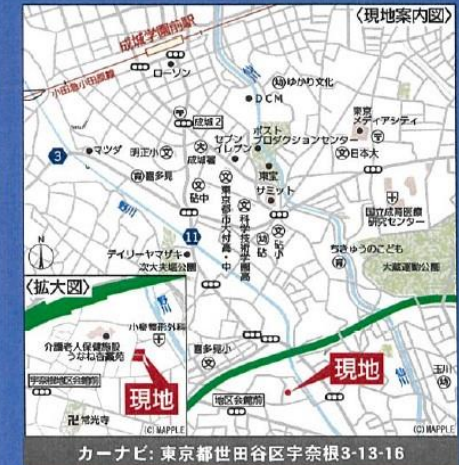
カーナビ: 東京都世田谷区宇奈根3-13-16