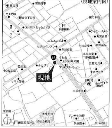
Car navigation 埼玉県さいたま市見沼区深作1丁目36-7

■土地面積:166.33㎡ ■建物面積:107.65㎡ ■建築確認番号:第24UD11W建05487号 (令和6年9月30日) 販売価格 3,380 (税込) 万円