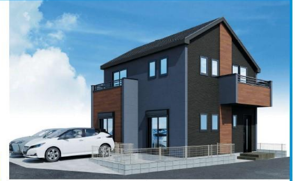
※パースはイメージ図です。現況と異なる場合は現況を優先してください。

【スマート】 パースはイメージ図です。現況と異なる場合は現況優先させていただきます。アクセントクロスカラーは異なります。また、開取りも本物件とは異なります。