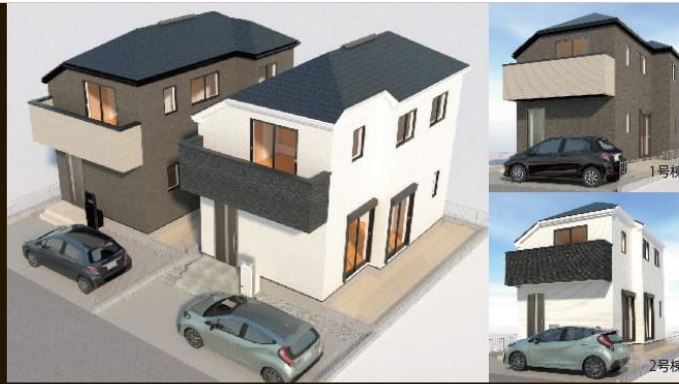
■イメージパース※図面を基に描き起こしたもので実際と異なる場合があります。