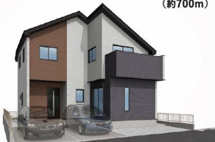
※実際とは異なる場合があります。