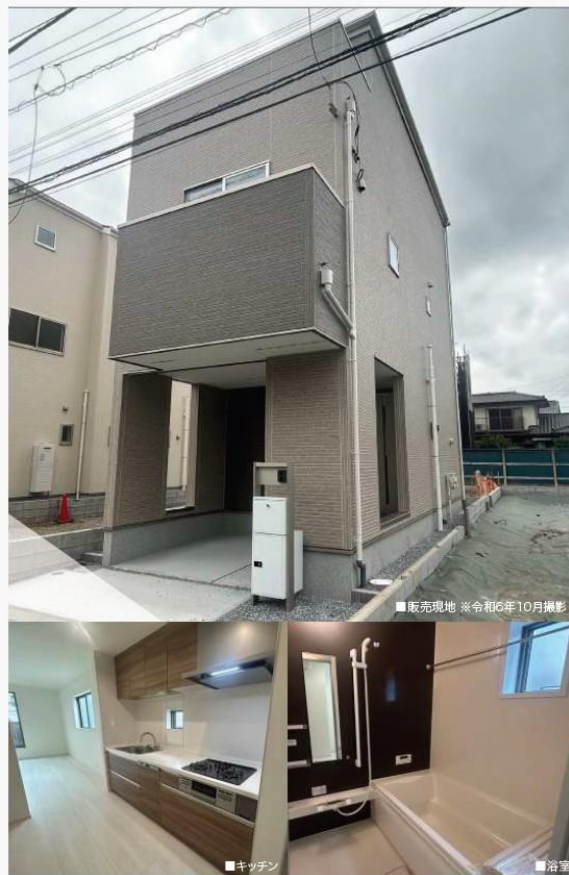
■販売現地 ※令和6年10月撮影