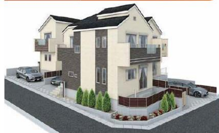
イメージパース※パースは図面を基に描かれたもので実際とは多少異なります。

京王井の頭線急行停車駅「久我山駅」徒歩7分&全棟敷地面積29坪超! 商店街至近で日用買物施設が豊富な住環境です!