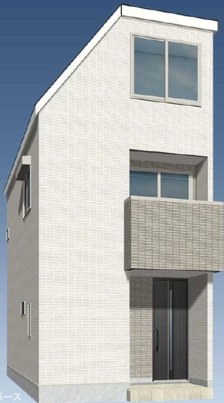
※外観イメージバース