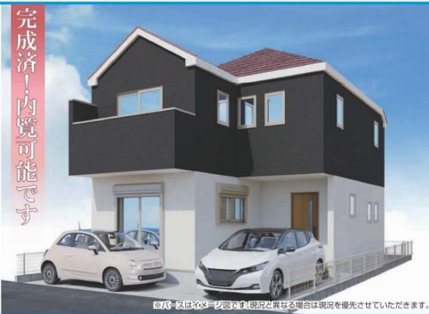
※バスはイメージ図です。現況と異なる場合は現況を優先させていただきます。

1号棟 3,999万円 (税込) 17.5帖のゆったりとしたリビングを中心に明るいファミリー空間を実現