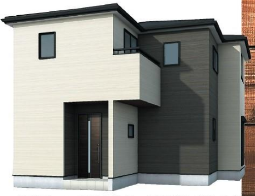
※完成予想図/このパースは図面を基に描いたもので実際とは多少異なる場合がございます。

物件番号 38EA-EF77 | 情報公開日 2025年03月31日 | 広告有効期限 2025年04月15日 | 仲介手数料無料+期間限定キャンペーン実施中!