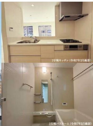
1号棟キッチン (令和7年3月撮影)

雨の日も濡れないビルトインガレージ採用、 対面式キッチンや充実の収納など、 住う人のことを考えたスマート設計。