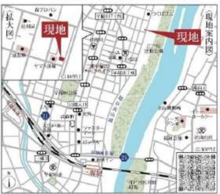
Car navigation 埼玉県三郷市早稲田7丁目37番15

1号棟 12.541 4.000 9.978 12.541 法42条1項1号市道 後退緩和みなし線 ※道路斜線後退緩和につき、門又は塀の高さは1.2m以下とする