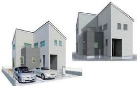
※完成予想図/このペースは前面を共に隣りたもので実際とは多少異なる場合がございます。

～L-STYLE仕様～ 閑静な住宅街に佇む1棟！お散歩に最適な江戸川河川敷が目の前♪