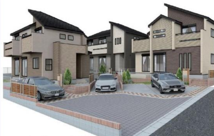
イメージパース※このイラストは図面を基に描きおこしたもので実際とは多少異なります。

「東村山・久米川駅」徒歩14分! 2駅2路線利用可能! 鷹の道やさくら通り沿いにも商業施設が豊富につき生活利便性良好!! 耐震ダンパー搭載で耐震性向上! 建物29~31坪超の多種多様なライフスタイルに合わせた高品質デザイン住宅6邸登場誕生! ★全棟住宅設備機器修理サービス対象物件あんしんプラチナパック15年保証12万円(税込)