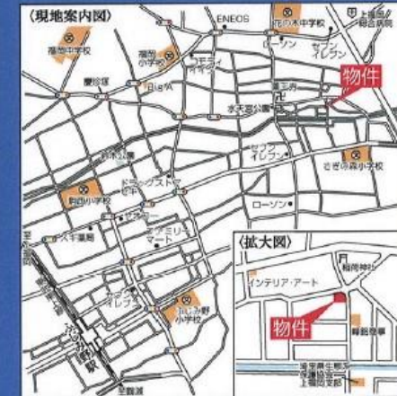
カーナビ:ふじみ野市水宮8-7 付近

さぎの森小学校 ..... 462m(徒歩 6分) 花の木中学校 ..... 848m(徒歩11分)