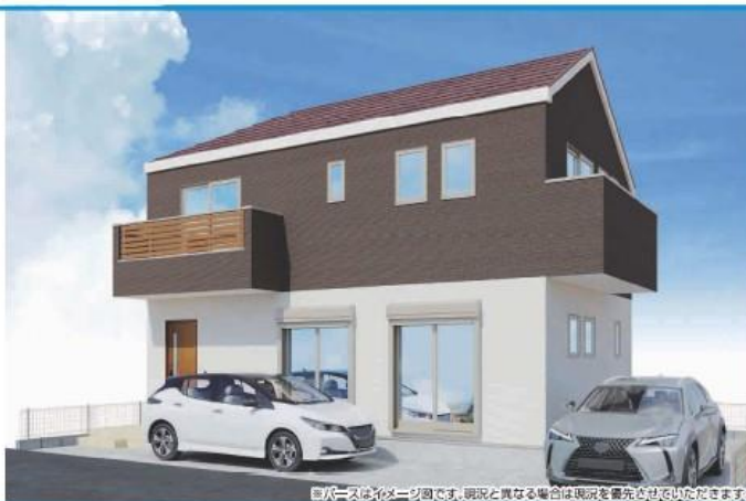
パースはイメージ図です。現況と異なる場合は現況優先させていただきます。