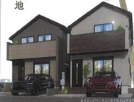
※イメージハウスにつき実際とは異なります。

南西公道に建ち並ぶ 陽当たりの良い2邸 小学校まで徒歩8分の 子育てファミリーに嬉しい立地