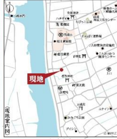
Car navigation 三郷市彦倉1-33

【物件概要】所在地/埼玉県三郷市彦倉1-33(地帯・住居表示)土地権利/所有権/敷地目/宅地/口数/棟数/4棟/販売棟数/4棟/建物構造/木造在来軸組工法2階建(910モジュール)都市計画/市街化区域/用途地域/第一種低層住居専用地域/建ぺい率/60%/容積率/100%/設備/電気/個別LPG/公費水道/下水口/接続状況/北側6.4m公道/西側4m公道/東側完成/2025年6月中旬引渡日/2025年6月下旬引渡/※広告の取扱いに関しては法令遵守にてお願いいたします。※期戸・期別・需給・カーテンレール・防水パン・カーポートはオプションとなります。※宅地内に電柱及び変電が入る場合があります。※司法書士上、当社指定となります。※図面と現況に相違がある場合は現況優先とします。※全棟が長期優良住宅対象物件です。広告有効期限/2025年2月28日