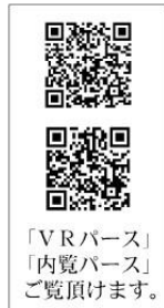
「VRパース」 「内覧パース」 ご覧頂けます。

【物件概要】口所在地/千葉県野田市中里東耕地579-1(地番)。千葉県野田市中里579-1(住居表示)口土地権利/所有権口地目/宅地口総棟数/15棟口販売棟数/15棟口建物構造/木造在来軸組工法2階建(910モジュール)口都市計画/市街化区域口用途地域/準住居地域・第1種住居地域口建ぺい率/60%口容積率/200%口設備/東京電力・個別LPG・公営水道・浄化槽口接続状況/北東側約4.38m公道・開発道路6m口現況/更地口完成/2024年12月下旬予定引渡日/2025年1月上旬予定引渡日/※広告の取扱いに関しては法令遵守にてお願いします。※薪戸・照明・溝縁・カーテンレール・防水パン・カーポートはオプションとなります。※宅地内に電柱及び支線が入る場合があります。※司法書士は、当社指定になります。※図面と現況に相違がある場合は現況優先とします。※全棟が長期優良住宅対象物件です。広告有効期限/2024年10月31日