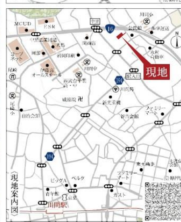
Car navigation 千葉県野田市中里579-3(近傍宅地)