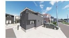
※完成予想図/このパースは図面に基いたもので実際とは多少異なる場合がございます。