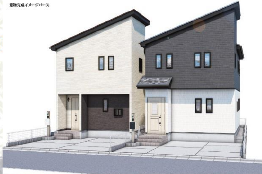
建物完成イメージパース