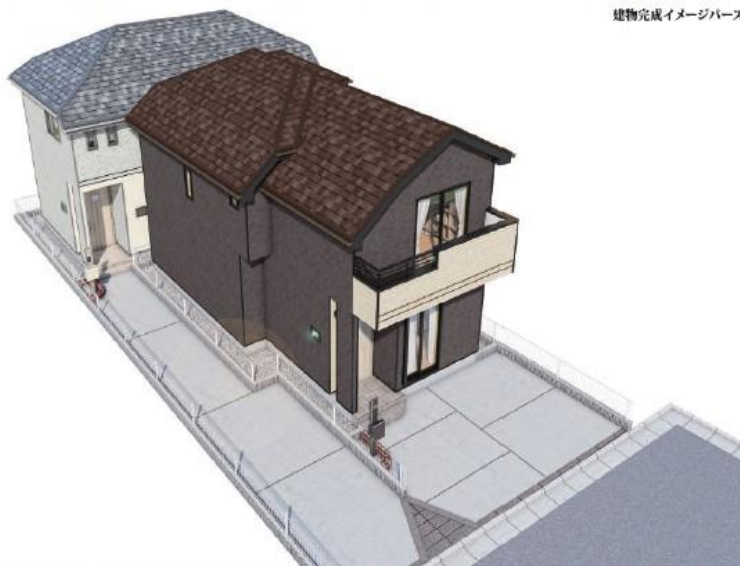
建物完成イメージパース