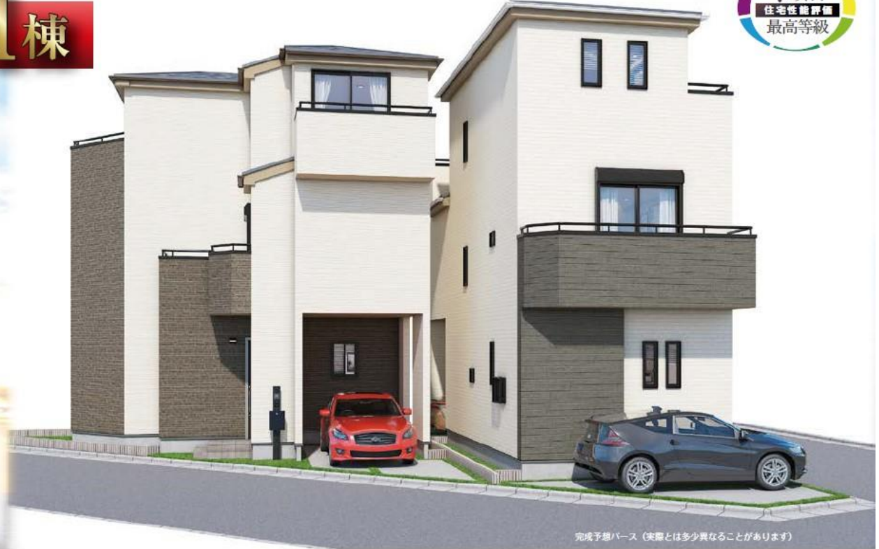
完成予想パース（実際とは多少異なることがあります）