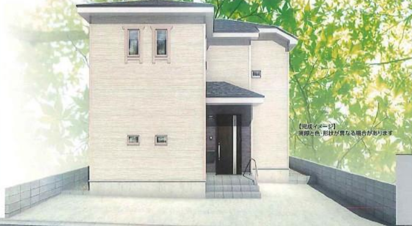
【完成イメージ】 実際の色・形状が異なる場合があります