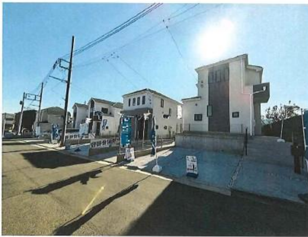
カーナビ入力 東大和高木 3-345 付近