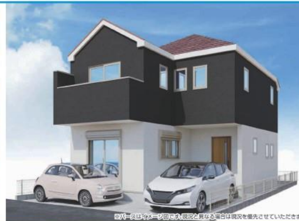
※写真はイメージ図です。現況と異なる場合は現況を優先させていただきます。