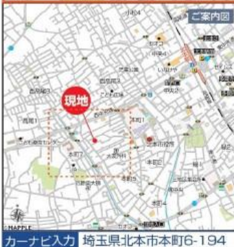
カーナビ入力 埼玉県北本市本町6-194