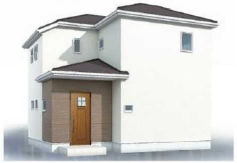
※完成予想図/このハウスは回廊を基にしたもので実際とは多少異なる場合がございます。

インテリアの統一感を作りやすい カウンタートップも楽々の洋室のみの間取りです サイズ 性能 価格 5.5m x 11.1m