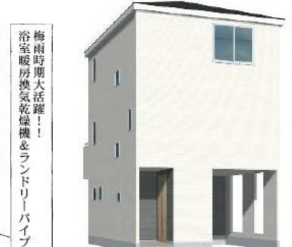
※完成予想図/このパースは図面を基に描いたもので実際とは多少異なる場合がございます。