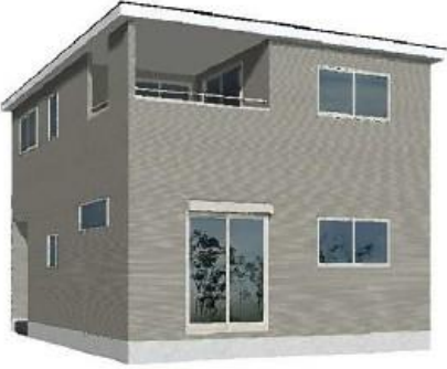
※完成予想図/このパースは実際を基に描いたもので 実際とは多少異なる場合がございます。