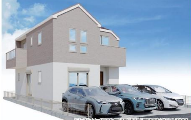
※パースはイメージ図です。実際と異なる場合は現況を優先させていただきます。