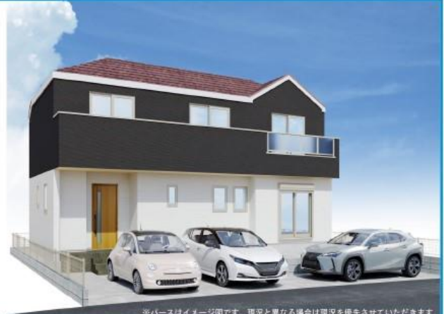
※バスはイメージ図です。現況と異なる場合は取説を優先させていただきます。