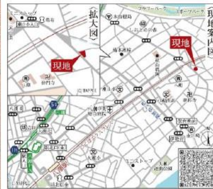
Car navigation 埼玉県八潮市南川崎36