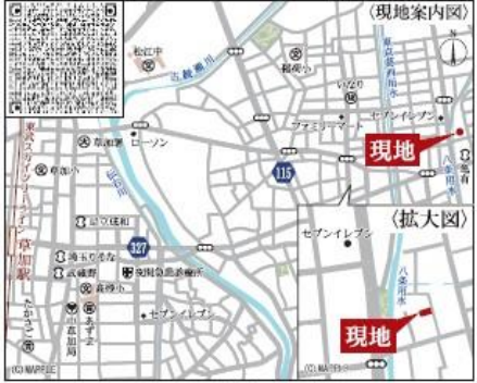
Car navigation 埼玉県八潮市鶴ヶ曾根868-15

■土地面積:116.98㎡ ■建物面積:95.63㎡ ■建築確認番号:第24UDLW建07989号 令和6年12月3日