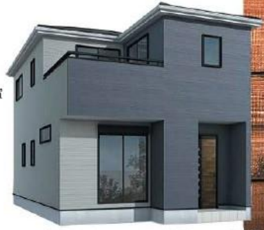
※完成予想図/このパースは図面を基に描いたもので実際と多少異なる場合がございます。

物件番号 1C45-8A87 情報公開日 2025年01月10日 広告有効期限 2025年01月25日 仲介手数料無料+期間限定キャンペーン実施中!