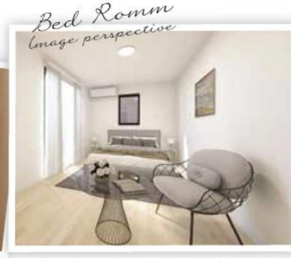
※内観イメージベースは図面を基に描き起こしたもので実際とは異なります。