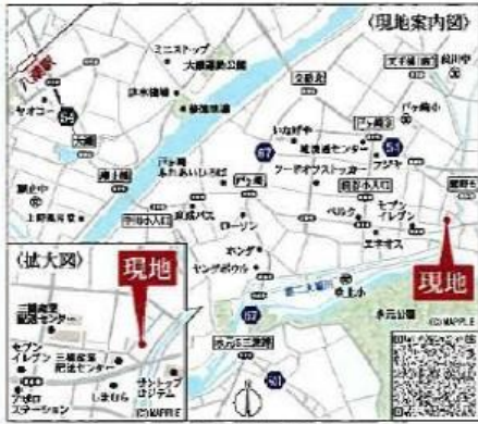
Car navigation 埼玉県三郷市戸ヶ崎3-739-2