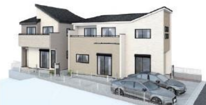
このイメージは実際の仕上がりとは異なる場合がございます。