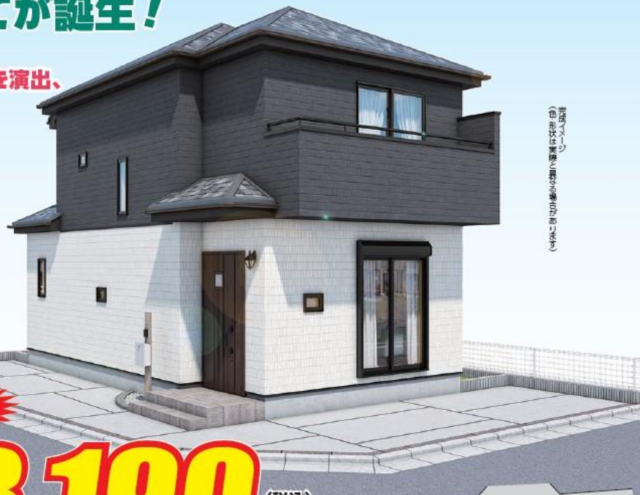
※このイメージはイメージです。実際とは異なる場合があります。