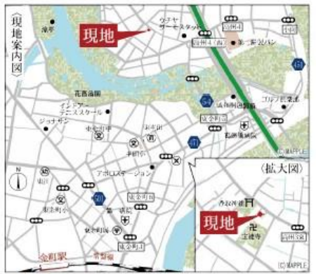
Car navigation 埼玉県三郷市高州3-125-6