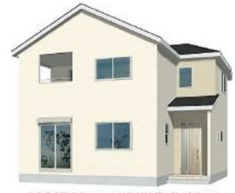
※完成予想図/このパースは地面を基に描いたもので実際とは多少異なる場合がございます。

[物件概要] 所在地/(地番)埼玉県三郷市高州3-125-1・(住居表示)埼玉県三郷市高州3-125-6 土地権利/所有権 地目/宅地 総棟数/1棟 販売棟数/1棟 建物構造/木造在来軸組工法2階建(900モジュール) 都市計画/市街化区域 用途地域/第1種中高層住居専用地域 建ぺい率/60% 容積率/200% 設備/東京電力・都市ガス・公営水道・本下水口 接続状況/北西側約4m私道・南東側4m私道 完成/2024年12月中旬予定 引渡日/2025年1月下旬予定 備考/※広告の取扱いに関しては法令遵守にてお願いたします。※願戸・照明・濡縁・カーテンレール・防水パン・カーポートはオプションとなります。※宅地内に電柱及び支線が入る場合があります。※司法書士は、当社指定になります。※図面と現況に相違がある場合は現況優先とします。※全棟が長期優良住宅対象物件です。広告有効期限/2024年10月31日