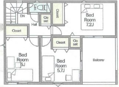
和の風情を演出する洋風和室 2F:44.14㎡(ルーフバルコニー-9.72㎡)