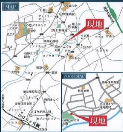
カーナビより新座市石神2-6-1付近と入力して下さい