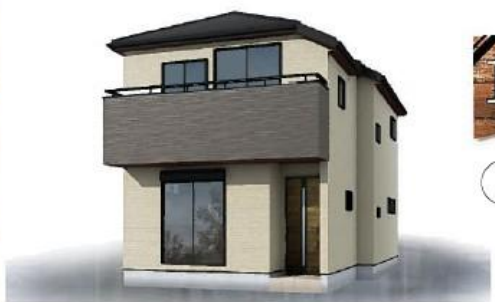
※完成予想図/このイメージは図面を基に描いたもので実際とは多少異なる場合がございます。