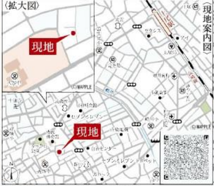
Car navigation 上尾市向山4-8-33