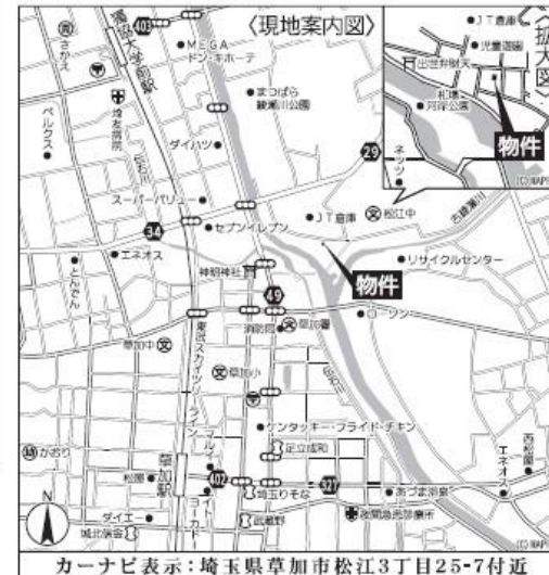
カーナビ表示: 埼玉県草加市松江3丁目25-7付近