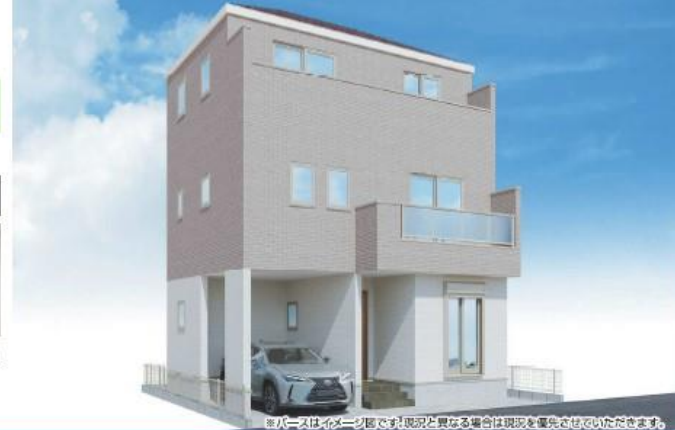
※パースはイメージ画です。現況と異なる場合は現況を優先させていただきます。

内装イメージ(スマート) パースはイメージ画です。現況と異なる場合は現況を優先させていただきます。