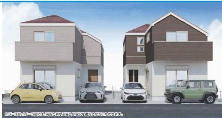
※写真はイメージです。実際と異なる場合は現況を優先させていただきます。