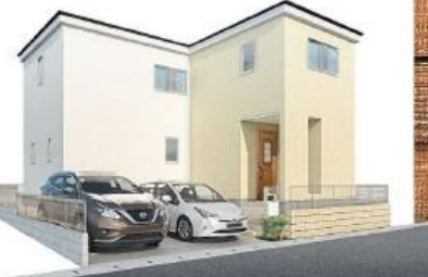
※完成予想図。このハースは図面を基に描いたもので実際とは多少異なる場合がございます。

〔物件概要〕□所在地/〔地番-住居表示〕千葉県野田市岩名1-40-8□土地権利/所有権□地目/宅地□総棟数/1棟□販売棟数/1棟□建物構造/木造在来軸組工法2階建(910モジュール)□都市計画/市街化区域□用途地域/第1種低層住居専用地域□建ぺい率/50%□容積率/100%□設備/東京電力・都市ガス・公営水道・下水道□接道状況/北側6m公道□現況/造成中□完成/2025年2月中旬予定□引渡日/2025年2月下旬予定□備考/※広告の取扱いに関しては法令遵守にてお願いします。※網戸・照明・濡縁・カーテンレール・防水パン・カーポートはオプションとなります。※宅地内に電柱及び支線が入る場合があります。※司法書士は、当社指定になります。※図面と現況に相違がある場合は現況優先とします。※全棟が長期優良住宅対象物件です。広告有効期限/2024年11月30日