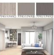
内装イメージ(スマート) ベースはイメージです。現況と異なる場合は現況優先させていただきます。アクセントクロスは異なります。また、間取りも本物件とは異なります。

オプション工事 承ります。 ※資料請求や内容については 担当までお問い合わせください。