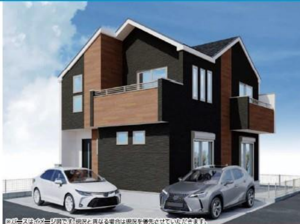
※写真はイメージです。実際と異なる場合は現況を優先させていただきます。

カーナビ入力: 西東京市向台町3-1-50付近 向台小学校 ..... 約 160m 薫風会山田病院 ..... 約 650m 田無第四中学校 ..... 約 500m イオンタウン田無 ..... 約 1,200m こひね幼稚園 ..... 約 400m ファミーマート西東京南町店 ..... 約 710m