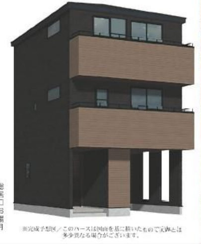
※完成予想図/このハースは断面を基に描いたもので実際とは多少異なる場合がございます。