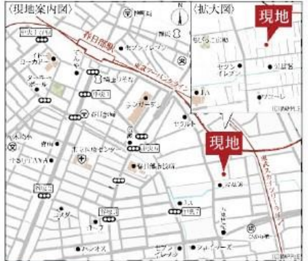
Car navigation 埼玉県春日部市南3-7-7

Life information 上沖小学校 ..... 1,200m (徒歩15分) 大沼中学校 ..... 1,900m (徒歩24分) ジョイフーズ春日部南店 ..... 625m (徒歩8分) セブンイレブン春日部南2丁目店 ..... 212m (徒歩3分) ドラッグストアセキ春日部東店 ..... 723m (徒歩10分) 春日部市立医療センター ..... 1,031m (徒歩13分) 春日部緑町郵便局 ..... 1,020m (徒歩13分)