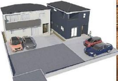
※実況と図面との相違は図面を基準にいたします。実況と図面との相違は図面を基準にいたします。