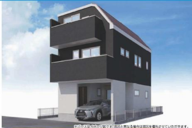
※パースはイメージ図です。現況と異なる場合は現況を優先させていただきます。

内装イメージ (スマート) パースはイメージ図です。現況と異なる 場合は現況優先とさせていただきます。 アクセントクロスは一部に設置します。 また、買取%も本物件とは異なります。