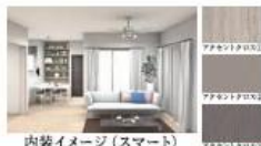
内装イメージ (スマート)